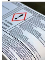
GHS - Prodotti chimici