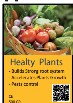
Orticoltura, Frutta & Verura